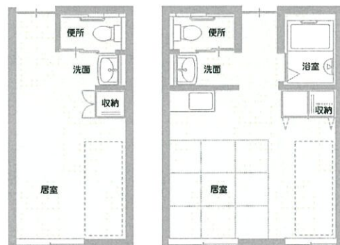
18㎡タイプ 便所○/洗面○/浴室×/台所×/収納○